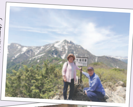
〔谷川岳(群馬県)にて〕

・昨年末から常住人員が三名から七名に増えたお寺の中で、一番働きに働いていてきた洗濯機がついにダウンしそうです。今度ばかりは、ご苦勞様でしたありがとうございます。私たちが身体も休養とメンテナンスが大切です。