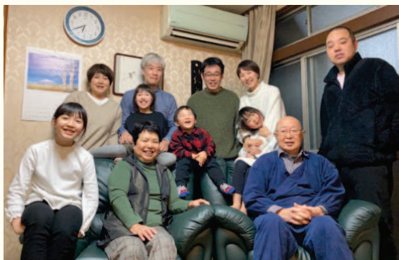
〔総勢11名の家族写真〕

会うは別れの始めです。思い残すことのないように孫たちによっかいを出しましょう。また、別れは寂しいけれども、楽しい再会への転換点でもあります。